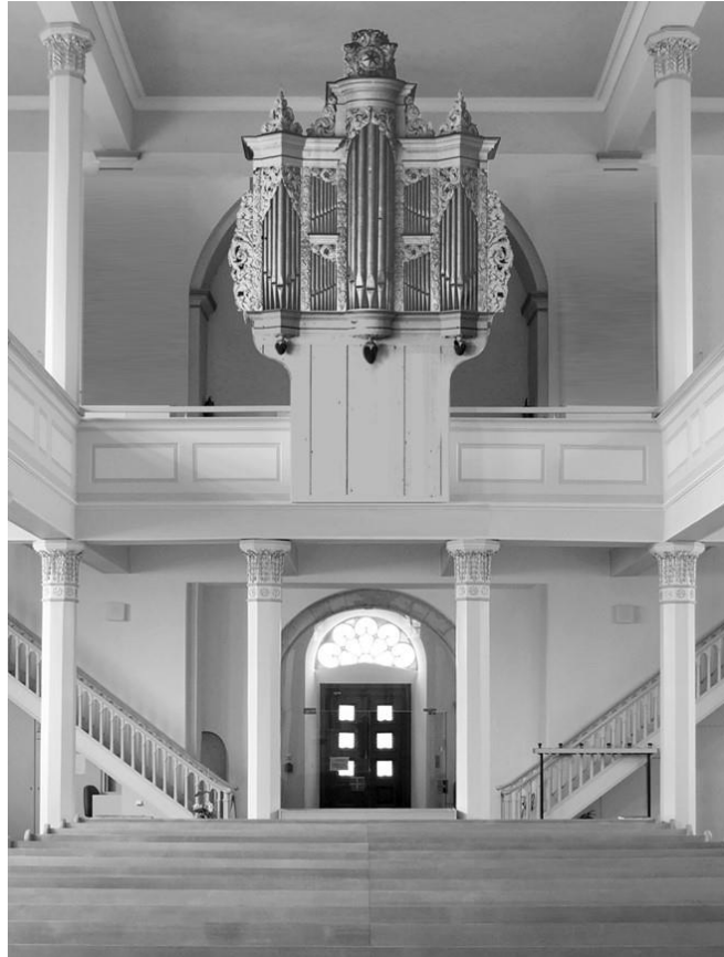
Abb 1: Entwurf einer möglichen Orgelansicht in der Stadtkirche

Unsere Orgel soll ein Spiegel der Gesellschaft sein, in der wir leben wollen. Nach außen ausgeglichen und unaufdringlich, im Wesen zugewandt und beständig. Bereit, in der immer schneller werdenden Welt durch Kontinuität einen Ruhepol zu bieten. Sowohl die kleinen wie die großen, die lauten wie die leisen Pfeifen werden gemeinsam oder einzeln zur Freude der Menschen und zum Lobe Gottes erklingen.