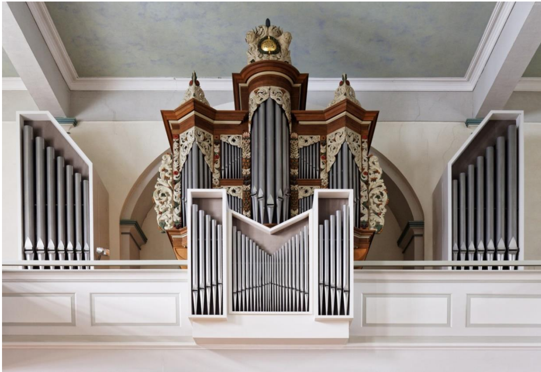
Abb 2: Empore der Stadtkirche Wermelskirchen bis 2017 (Willi-Peter-Orgel mit Pedaltürmen und Rückpositiv von 1969, Wiederverwendung von barocken Fassadenelementen der ehemaligen Weidtmann-Orgel von 1713