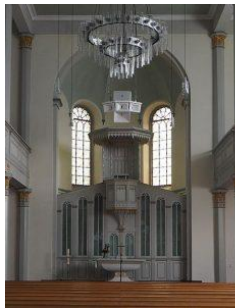
Abb 4: Apsis mit Kanzelwand und Kanzel